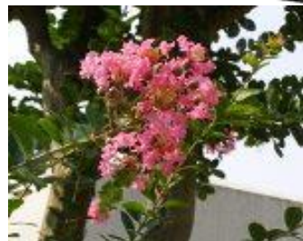
◎サルスベリ(別名:百日紅)