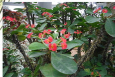
～ハナキリン～ トウダイグサ科 学名: Euphorbia milii cv. 原産: マダガスカル

マダガスカルに原生。高さ1～2mになる低木で、茎は多数の鋭い刺をもち、分岐して広がる。葉は長さ3～5cmぐらいで、花のように見えるのは花ではなく苞葉である。枯れたように見える枝も多肉質で乳液を言んでいる。乾燥すると葉を落とす。多くの園芸品種がある。