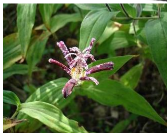
◎ホトトギス(杜鵑草)